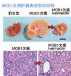
マウスに皮下移植した胆管癌細胞株の増殖抑制

がんは、死因の第1位であり、人類にとっては最も脅威で、何よりも優先的に研究すべき対象疾患です。我々は分子生物学・細胞生物学・生化学・発生工学などの技術を駆使して、がんの発症・進展の分子メカニズムの研究を行っています。がん関連遺伝子シグナルとして最も代表的なp53経路やPTEN/PI3K経路、及び近年注目されてきているHippo経路シグナルに関与する分子の遺伝子改変動物をこれまでに多数作製してきました。これによってこれらシグナル経路の異常が種々のがんや、自己免疫病・心不全・糖尿病・非アルコール性脂肪性肝炎などのがん以外の主要な疾患の発症・進展にも関与すること、さらに個体の発生・分化にも重要であることを示してきました。作製した遺伝子改変動物はこれら疾患のマウスモデルとして、疾患本態の解明に重要です。また近年これらシグナル経路を標的とする新規治療薬開発にもチャレンジしており、これらマウスは薬剤の効果判定に非常に有用となります。我々は、これらのアプローチにより、がんの発症・進展メカニズムとその治療戦略を科学します。