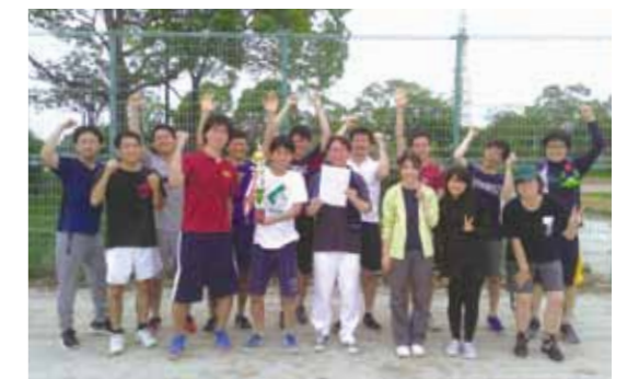
ある年のソフトボール大会 (優勝です!)

「できること ではなく、やらなければ ならないことをやる」を モットーに、様々な 研究手法を駆使して、 生命現象の謎解きに 挑戦中!