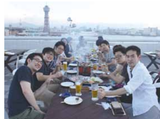
ある飲み会の one scene